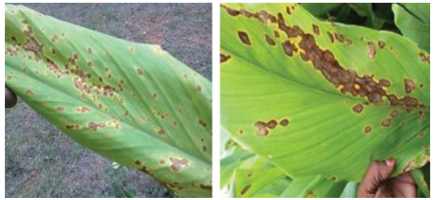
పసుపు పంటలో ఆకు మచ్చ తెగులు ఆశించిన పత్రాలు