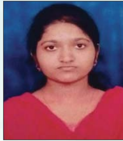
బి. సైని ప్రియాంక దివాందిన్నె, ఎమ్మిగనూరు మం., కర్నూలు జిల్లా