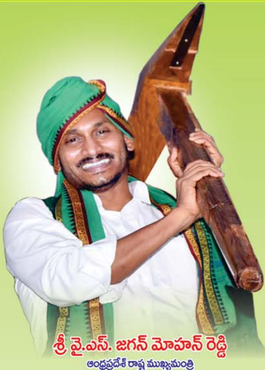
శ్రీ వై.ఎస్. జగన్ మోహన్ రెడ్డి ఆంధ్రప్రదేశ్ రాష్ట్ర ముఖ్యమంత్రి