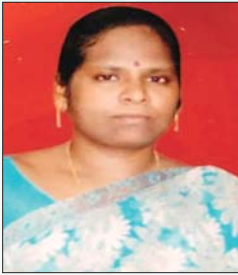
యం. స్తుతి గీత చింతయపాలెం, కర్లపాలెం మం., గుంటూరు జిల్లా