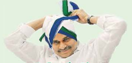
డా॥ వై.ఎస్. రాజశేఖర రెడ్డి గారు దివంగత ముఖ్యమంత్రి