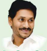
శ్రీ వై.ఎస్. జగన్ మోహన్ రెడ్డి గారు గౌరవ ముఖ్యమంత్రివర్యులు, ఆంధ్రప్రదేశ్ ప్రభుత్వం