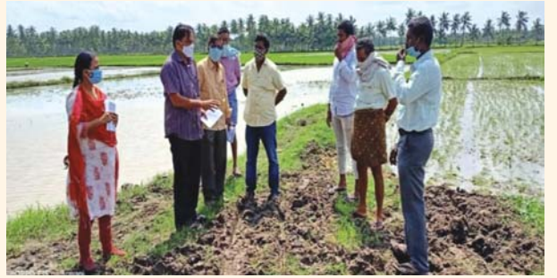
ముంపు బారినపడ్డ వరి అయినాపురం గ్రామం, ముమ్మిడివరం మండలం