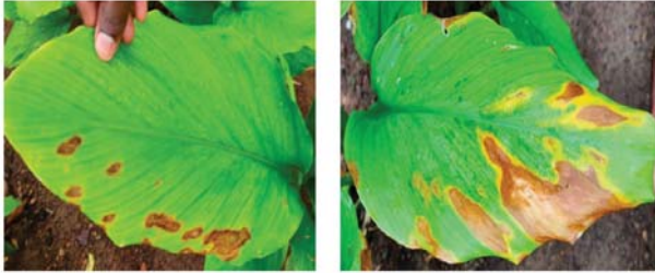
తాటాకు మచ్చ తెగులు ఆశించిన పసు పు పంట

తెగులు ఉధృతి ఎక్కువగా ఉంటుంది. ఆకులపై పెద్ద పరిమాణంలోనున్న అండాకారపు మచ్చలను అక్కడక్కడ గమనించవచ్చును. మచ్చలు ముదురు గోధుమ వర్ణంలో ఉండి మచ్చ చుట్టూ పసుపు రంగు వలయం ఉంటుంది. ఆకు కాడపై కూడా మచ్చలు ఏర్పడడం వలన ఆకులు క్రిందికి వాలిపోతాయి.