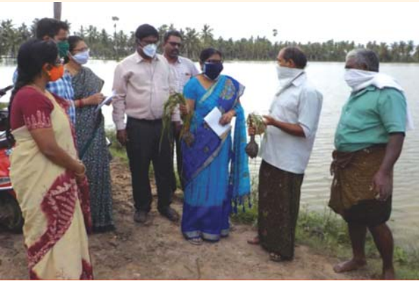
ముంపు బారినపడ్డ వరిపొలాలు రాజోలు గ్రామం, రాజోలు మండలం